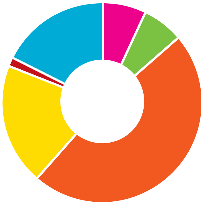
Rozdělení nadačních příspěvků dle účelů

Nadace Duhová energie rozdělila v roce 2004 prostředky v celkové výši 161,8 milionu Kč, což ji řadí mezi největší nadace v České republice. Do oblasti kultury věnovala 11,4 mil. Kč, zdraví 10,8 mil. Kč, dětem a mládeži 77,6 mil. Kč, do rozvoje regionů 32,1 mil. Kč, na zlepšení životního prostředí 1,2 mil. Kč a potřebným (na charitativní, humanitární a sociální účely) 28,8 mil. Kč.