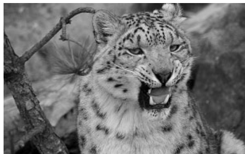
Zoologická a botanická zahrada města Plzně

Krajská knihovna získala od Nadace ČEZ grantový příspěvek 0,95 mil. Kč na doplnění, rozšíření a aktualizaci knihovního fondu spojeného s otevřením nového sídla knihovny. V Karlovarském kraji tím vzniklo nové informační a vzdělávací centrum, které tak významně přispěje k rozšíření a zkvalitnění poskytovaných knihovnických služeb.