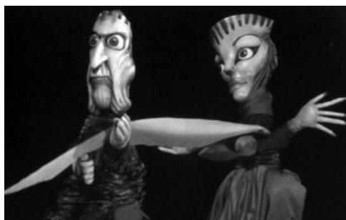
Mezinárodní divadelní festival – XI. ročník

Podporu získala také ZOO Dvůr Králové nad Labem a Krkonoše – svazek měst a obcí.