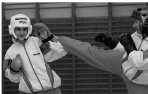
Kick-box dětem – sportem proti drogám

V oblasti kulturních projektů nadace podpořila Občanské sdružení Adria na realizaci „Slovenského divadla v Praze 2005“. Umělecká beseda vynaložila nadační příspěvek na vydání výstavního katalogu – Pocta Václavu Rabasovi, Střední průmyslová škola elektrotechnická v Kutné Hoře pořídila vybavení své učebny, Střední průmyslová škola Vlašim rozšířila vybavení elektrolaboratoří, Obchodní akademie v Praze vynaložila příspěvek na podporu projektu Škola třetího tisíciletí a První jazyková základní škola v Praze zřídila školní počítačovou síť. Hokejový klub Kladno získal od Nadace ČEZ příspěvek na podporu činnosti mládežnického hokeje HC Rabat Kladno. Nadace dále podpořila sportovní kluby HC Berounští medvědi, Sokol Kolín, Wu-shu Team Teplice a Fighters Team Praha se sídlem ve středních Čechách. Nadace podpořila projekt Linka bezpečí, Mateřskou školu Pohádka v Kutné Hoře. Ústav sociální péče Červený Hrádek vynaložil věnovanou částku na výstavbu rehabilitačního a sportovně rekreačního areálu, Soukromá speciální škola Slunce o.p.s. získala prostředky na zakoupení školního autobusu. Fakultní nemocnice Na Bulovce obdržela nadační příspěvek na podporu léčby onemocnění glaukomem. Nadace ČEZ také podpořila nákup technického vybavení pro hasičský sbor dobrovolných hasičů v obci Slapy nad Vltavou.