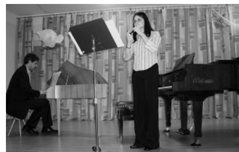
Nový koncertní sál Základní umělecké školy v Přelouči

13. ročník národní abilympiády se konal v Pardubicích za finanční podpory 50 tis. Kč od Nadace ČEZ. Přes 200 převážně mentálně postižených osob se zúčastnilo celé řady řemeslných a volnočasových aktivit. Součástí doprovodného programu byl koncert nebo facepainting.