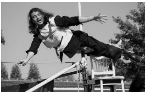
Festival Spectaculo Interesse Ostrava

K dalším úspěšným počínům nadace v roce 2005 patřil projekt „Duhové kolo“ (dnes s názvem „Oranžové kolo“), které se účastnilo mnoha významných kulturních a sportovních událostí v České republice. V severomoravském regionu obdarovalo „Oranžové kolo“ v roce 2005 například děti z Kojeneckého ústavu v Ostravě-Zábřehu, děti z Dětského domova v Ostravě-Hrabové či Speciální školu Foibé Diakonie v Ostravě-Vítkovicích, která se stará o vzdělání dětí s těžkými vadami.