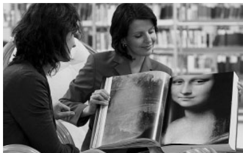
Krajská knihovna Karlovy Vary

Nadace podporuje například vyšetření dárců kostní dřeně pro Český národní registr dárců kostní dřeně v Plzni, Klub českých turistů a jeho cyklotrasy, program protidrogové prevence v Karlovarském kraji či vznik multifunkčního centra vzdělávání a nákup knihovního fondu Krajské knihovny Karlovy Vary.