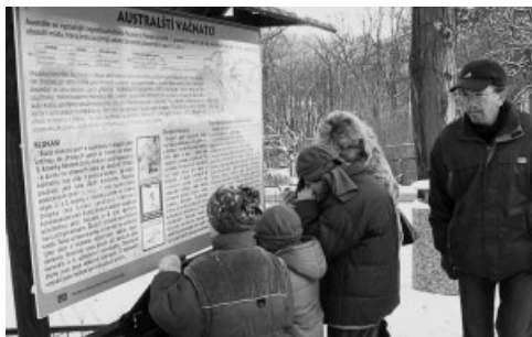
ZOO Ostrava handicapovaným dětem

Nadace ČEZ věnovala příspěvek ve výši 150 tis. Kč na konání 6. ročníku mezinárodního loutkářského festivalu Spectaculo Interesse Ostrava. Prestižního světového festivalu se zúčastnilo 28 divadelních souborů ze 12 zemí včetně zástupců České republiky. Festival navštívilo 3 562 diváků, kteří mohli shlédnout na 40 představení v několika divadlech po celé Ostravě a některá přímo v ulicích města. Akce byla odbornou i laickou veřejností hodnocena jako mimořádná kulturní událost nejen v moravskoslezském kraji.