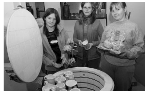
Hrnčířská pec pro postižené osoby

V roce 2005 přispěla Nadace ČEZ částkou 1 mil. Kč plzeňské zoologické zahradě na úpravu geografické expoziční části Jižní a Severní Amerika. Zahrada tak může svým návštěvníkům nabídnout další zajímavý prostor, který svým řešením zapadá do koncepce celé ZOO.