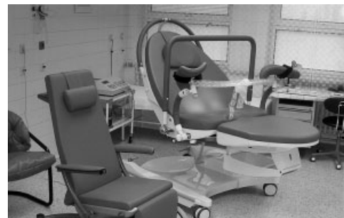
Zakoupení porodní postele pro porodnické oddělení Nemocnice s poliklinikou v Karviné-Ráji

Z příspěvku Nadace ČEZ v hodnotě 212 tis. Kč mohla ostravská zoologická zahrada zpřístupnit a přiblížit celý areál handicapovaným osobám. V rámci podpořeného projektu byly vybrané expozice opatřeny cedulkami a popiskami v Braillově písmu a otisky stop zvířat. Nainstalovány byly i informační tabule s dotykovými prvky.