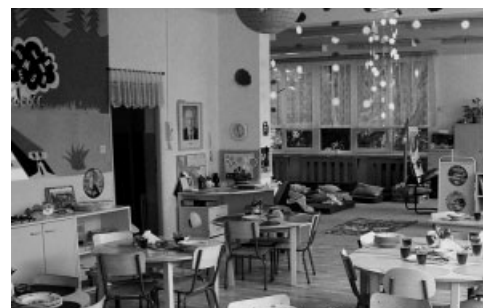
Vybavení školní kuchyně mateřské školy Pohádka v Kutné Hoře

Nadace ČEZ věnovala 65 tis. Kč na projekt čištění břehů a některých dostupných míst dna řeky Vltavy v oblasti obcí Štěchovice a Davle. Odstraněno bylo mimo jiné i několik přímých zdrojů znečištění, jakými jsou ropné produkty, barvy nebo baterie. Tento odpad byl roztříděn a uložen na řízené skládce. Díky pravidelným aktivitám Sdružení za čistou Vltavu bylo zjištěno, že míra znečištění oproti minulým letům klesla.