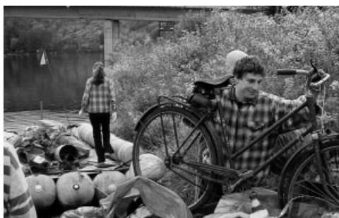
Čištění Vltavy v úseku Štěchovice

Spolupracující kluby Wu-shu Team v Teplicích a Fighters Team v Praze obdržely od Nadace ČEZ příspěvek v hodnotě 250 tis. Kč. Kluby vychovávají mladé sportovce tak, aby nezneužívali získaných dovedností. Členy týmů jsou jak chlapci, tak děvčata.